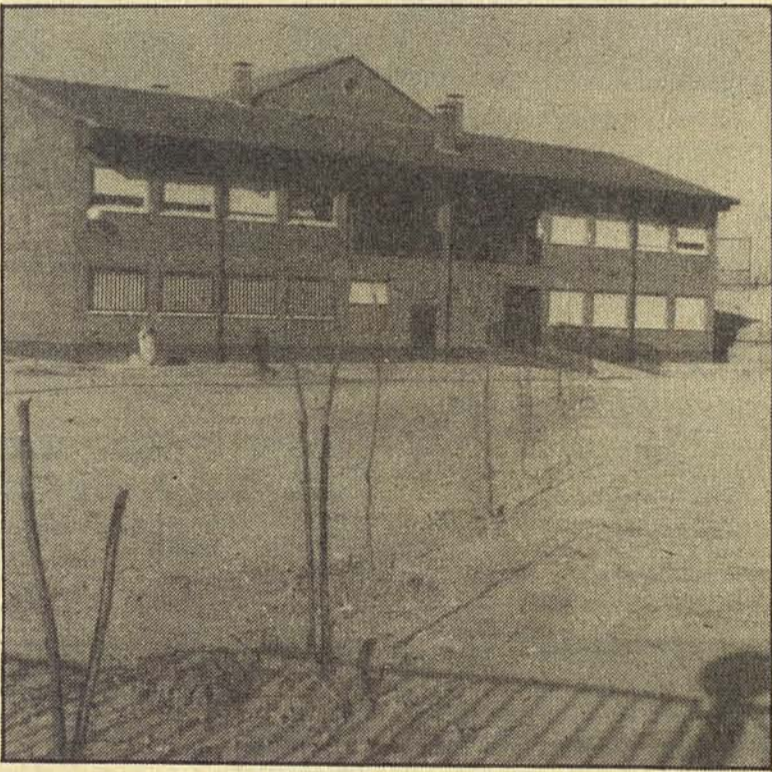
Colegio Público Gregorio Marañón plantación de árboles, actual.

Vine aquí hace 15 años, y el barrio consistía en 15 bloques de viviendas, no había más, ni tiendas, ni panaderías, ni médicos, en fin, nada. Por no haber no había ni colegios. Hoy, 15 años después, es uno de los mejores barrios de Toledo. Tenemos colegios, institutos, guarderías, pero no uno, sino 5 colegios de EGB, una guardería, un instituto de enseñanza media, otro de formación profesional, un centro cívico donde hacen toda clase de trabajos manuales, un polideportivo, una piscina y ¡ah! lo más importante unas escuelas de adultos donde podemos recordar lo poco que aprendimos las personas de mi edad, 62 años, y estoy en el colegio con una ilusión como si fuera una colegiala de 15, pues no tengo complejos de que se sepa que estoy en el colegio. Tenemos en el barrio un montón de analfabetos, que si no tuviesen complejos de que las vecinas o amigas se enteren que no saben escribir y leer, pues la verdad, que ganarían mucho, para mí era penoso que mis nietos me preguntaran muchas cosas que yo no podía contestar, eso me acoplejaba.