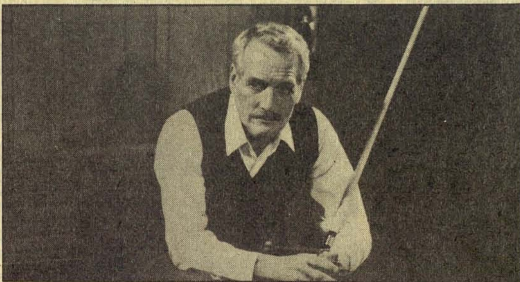
Paul Newman, nominado de nuevo al Oscar de la Academia por su interpretación en “El color del dinero”.