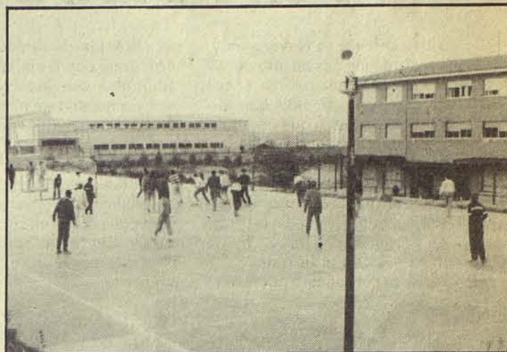
El Instituto de Enseñanza Media, al igual que F.P. esperan la avalancha.

resulta vergonzoso que por ejemplo 54 viviendas del programa 826, entregadas hace años, sigan cerradas. Después de ser denunciado varias veces, la Administración pasa olímpicamente, con dicha postura, apoya y confirma lo fácil que es participar en concursos públicos de Asistencia Social (vivienda social) vulnerando y burlando toda norma. Un bonito ejemplo de enseñanza hacia el contribuyente.