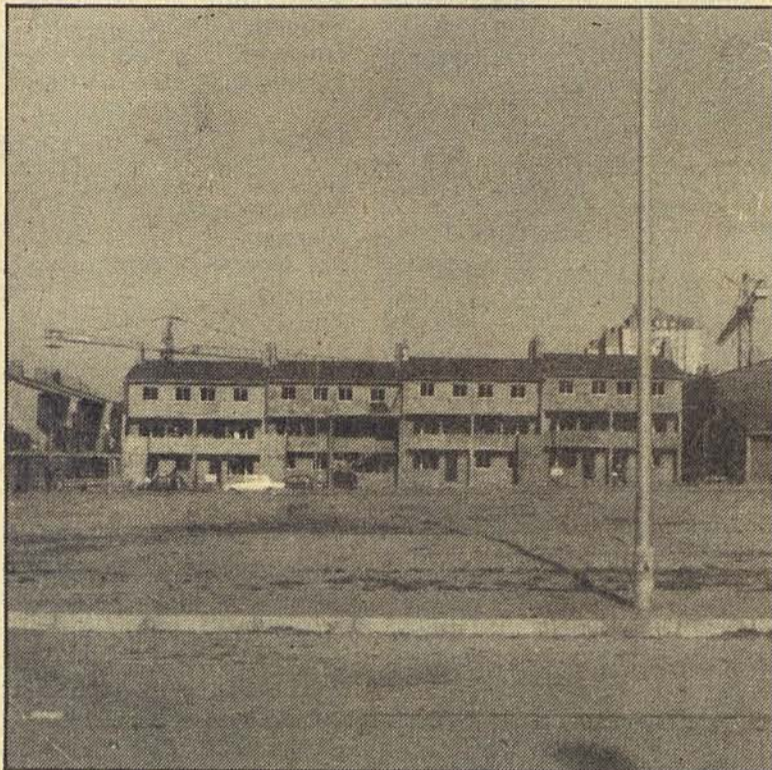
Nuevo duplex frente al Centro Cívico.