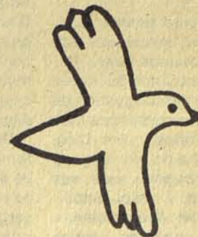
Guerra no, paz sí

La paz es bella ¡Ojalá hubiera paz! Los que hacen la guerra no conocen la paz si la conocieran no lucharían más. ¿Por qué lucharán? ¿Por qué lucharán? Sólo quieren el poder ¡Ojalá conocieran la paz!